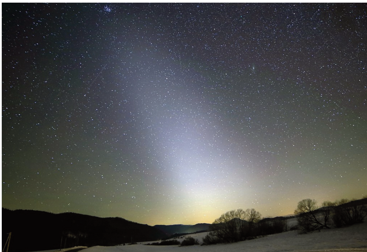
Zodiakálne svetlo, Šumiac, 15.2.2015.

Telgárt a okolie sa nachádza v horách v nadmorskej výške okolo 1000 metrov, nočné teploty tu klesajú v polovici jesene už hlbšie pod bod mrazu, preto oceníte ak prídete na akciu s kvalitným zimným oblečením, pevnou a nepremokavou obuvou s návlekmí. Nad ránom býva na lúkach zvyčajne rosa a vysoká vlhkosť. Pretože budeme v noci fotografovať až do úsvitu, ostane málo času na nočný odpočinok. Program fotografického workshopu budeme operatívne meniť podľa aktuálneho počasia. V prípade hmly v údolí budeme mať zabezpečený odvoz do priestoru nad vrchnú hranicu hmly.