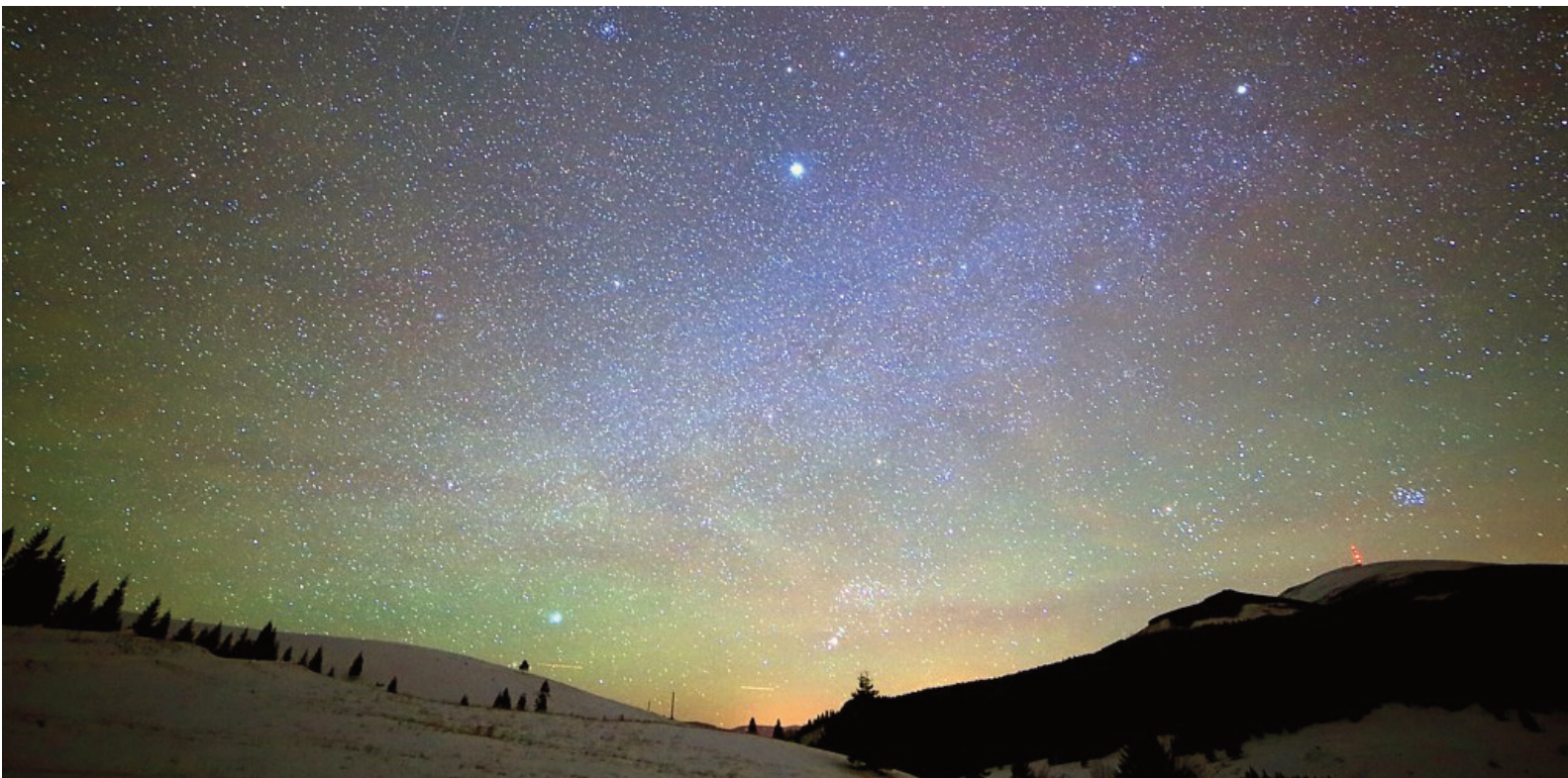
Prírodné žiarenie atmosféry (airglow) v sedle Besník pri Telgárte 14.12.2013.